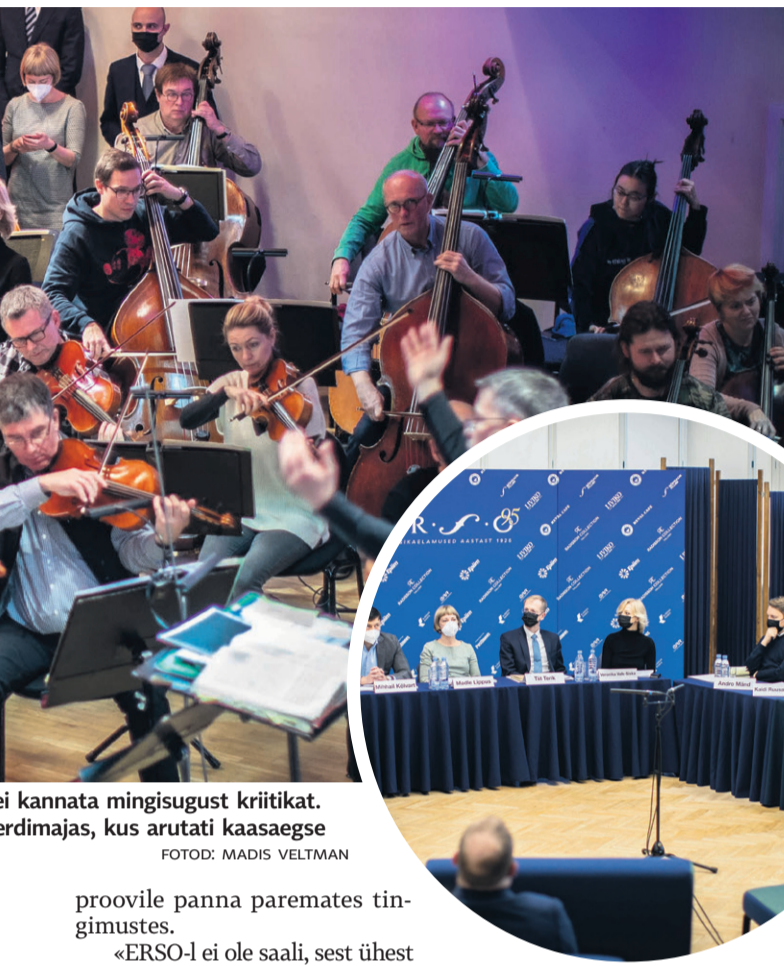
ei kannata mingsugust kriitikat. Konserdimajas, kus arutati kaasaegse