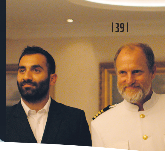
Arvin Kananian ja Woody Harrelson filmis „Kurbuse kolmnurk“