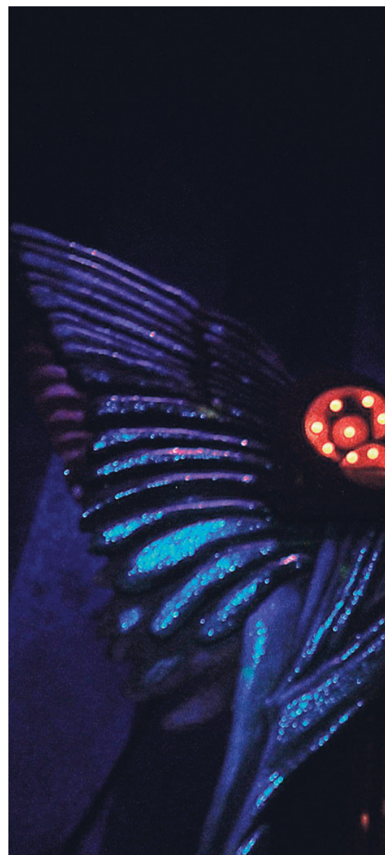
2015. aastal kogus kõige suurema publikuarvu Estonia