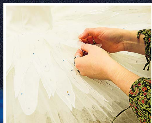
SULEMERI: Kostüümide jaoks lõigati käsitsi välja 7000 sulge, mis käivad kostüümidele kolmes kihis. Masinavärki, mis selle kõik ära teeks, pole olemas.