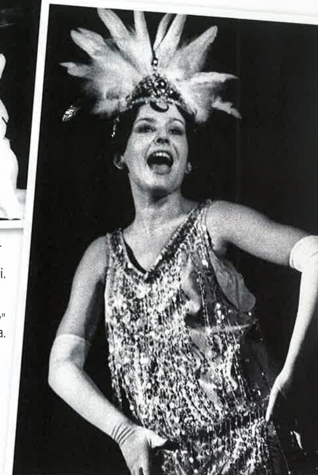
1971 Opereti "Minu sõber Bunbury" naispeaosas Cecily Cardewina.