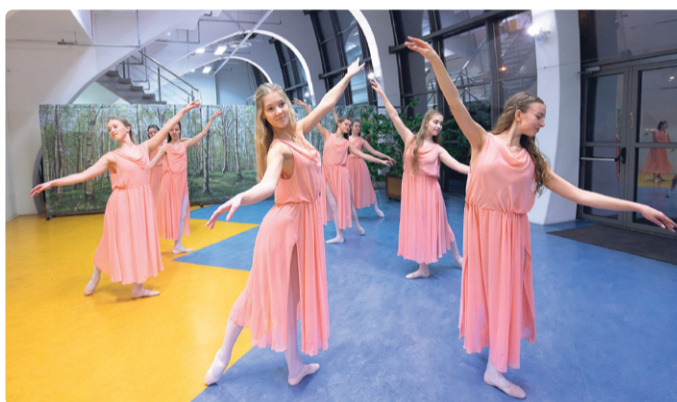
Fotonäituse «Hetked» tantsisid avatuks Kaurikooli noored baleriinid.

Ballett, mille etenduselt ei õnnestunud saada ainsatki head fotot, oli «Pähklipureja». «Tundub, et igast otsast tuleb ilusaid poose, aga ei – kord on kellelgi silmad kinni, kord on kellelgi käsi või jalg kõver. Ei tule pilti.» Samas võib juhtuda, et ühelt etenduselt saab häid fo-