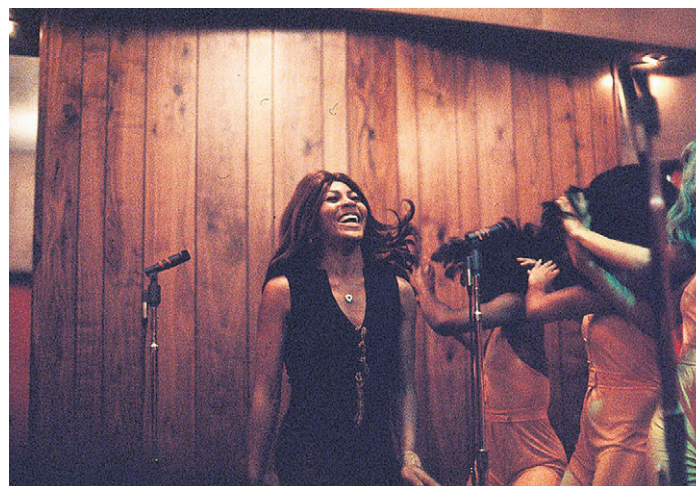
Noor Tina Turner 1973. aastal, vabanemiseni vägivaldsest Ike'ist on jäänud veel kolm aastat.

Lootsin, et filmi teine pool pühendub rohkem tema muusikale, paraku jätkati seal minevi-