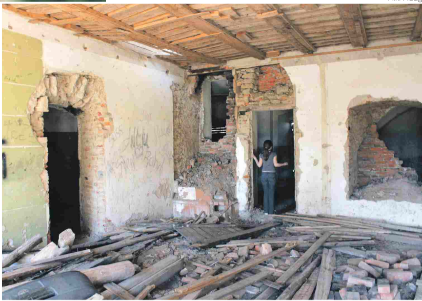
NUKKER ALGUS: Peningi mõisa fuajee 2008. aastal.