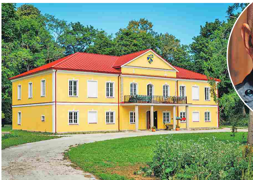
RÕÕMSAD TOONID: Peningi mõis 2023. aastal.