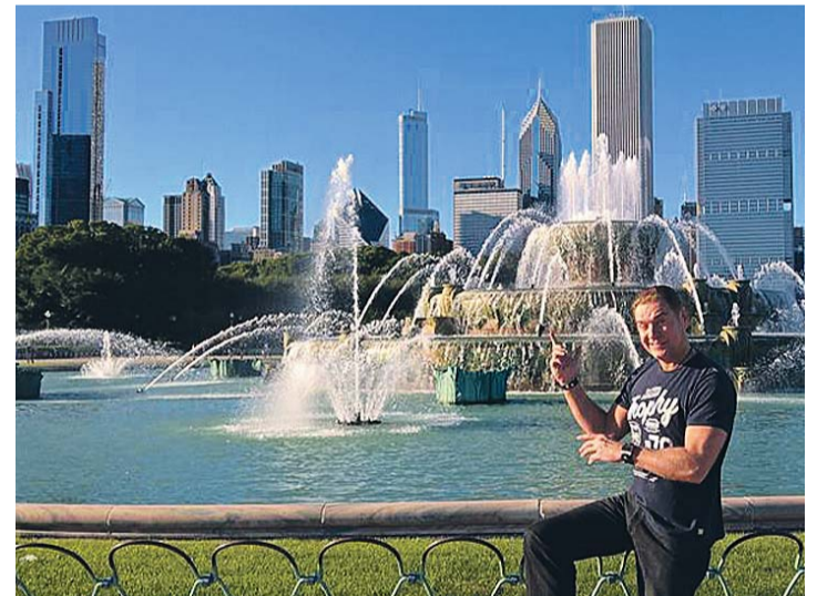
TURISTIPILT: Chicagos Buckinghami purskkaevu taustal, mis on üks maailma suurimaid fontääne.