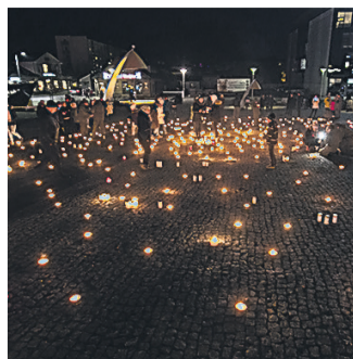
Sajad küünlad Rakvere Keskväljakul mullusel hingedepäeval.

2007. aastal esines Prince USA suurima telesõu ehk