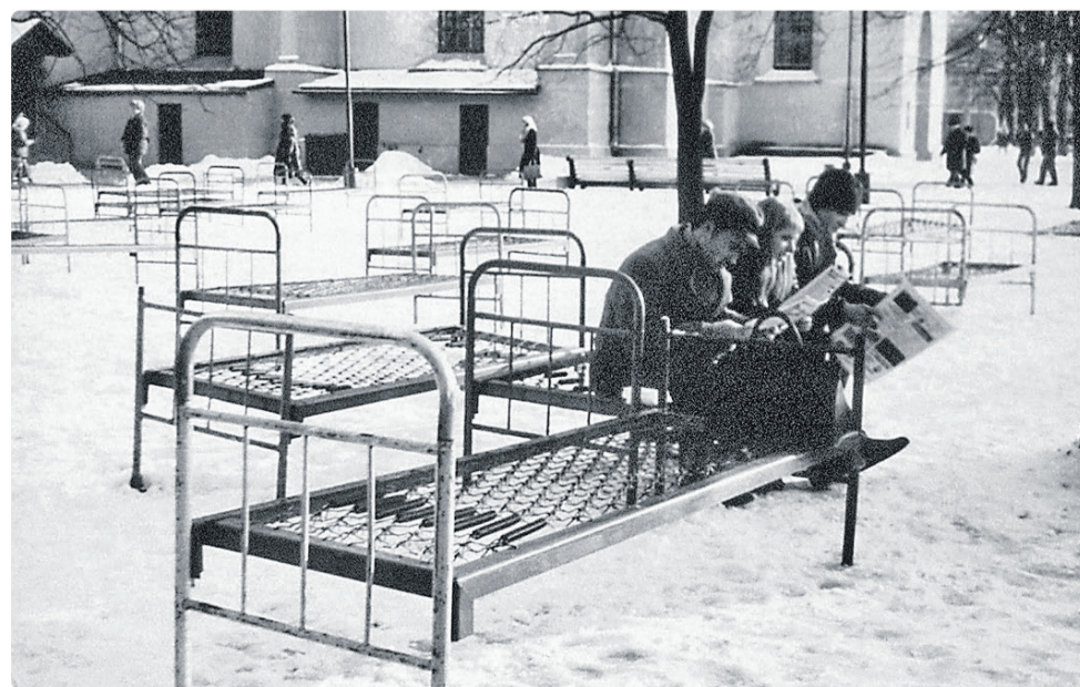
Jaan Toomiku installatsioon «Voodi 75» aastast 1993.

Oma kontseptuaalset kunstiteost kirjeldab kunstnik järgmiselt: «Tume kobar, milles on varjul kontrolli alt libisenud emotsioonid ja spontaansed raevupursked. Niidi otsas rippuv raskus pea kohal, inimloomuse tume pool. Must planeet taevas. Üheaegselt habras