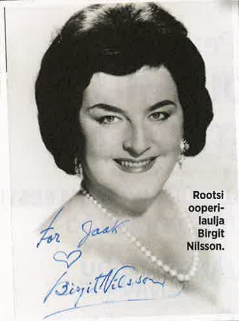
Rootsi ooperilaulja Birgit Nilsson.