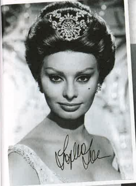
Itaalia filminäitlejanna Sophia Loren.