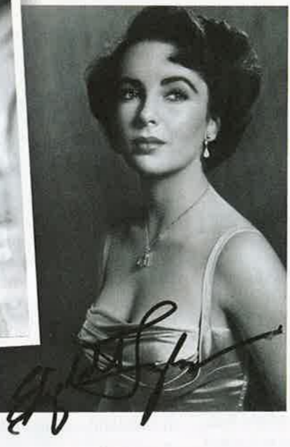
Ameerika filminäitlejanna Elizabeth Taylor.