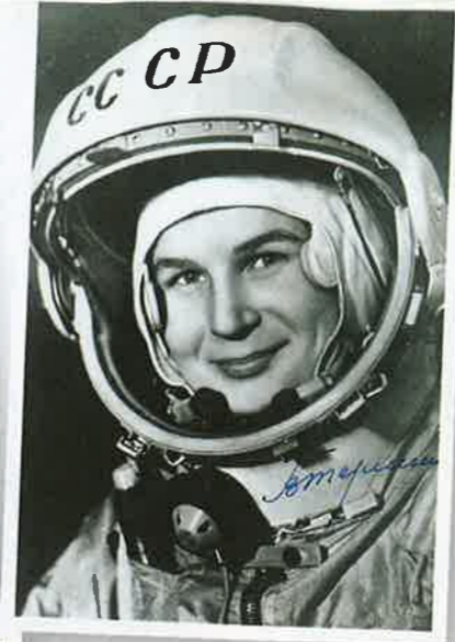
↑ Nõukogude kosmonaut Valentina Tereškova.