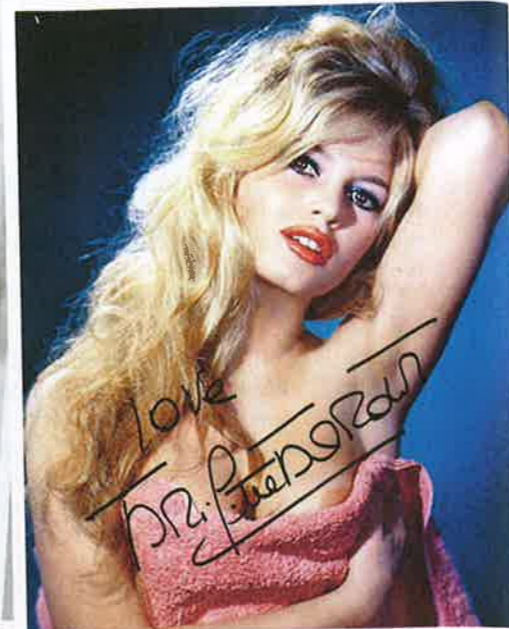
Prantsuse filminäitlejanna Brigitte Bardot.