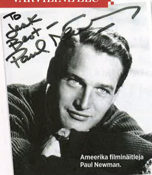
Ameerika filminäitleja Paul Newman.