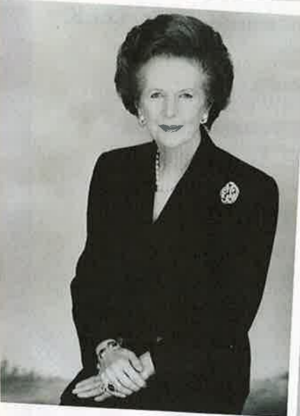
← Suurbritannia endine peaminister Margaret Thatcher.