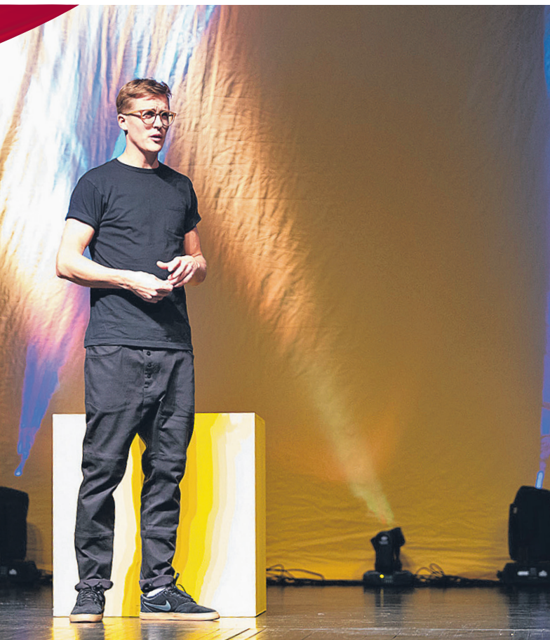
Enim vaadatud grow-up-lavastuse «The Kid» esietendusel.