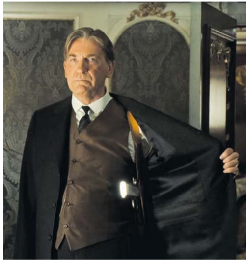
David Warner 1997. aasta menufilmis „Titanic“.