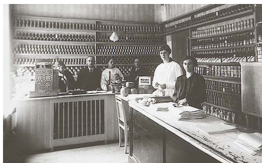
ÜKS TEATRI OLNUD POODIDEST: esimese korruse kaupluste tüüpiline sisevaade.