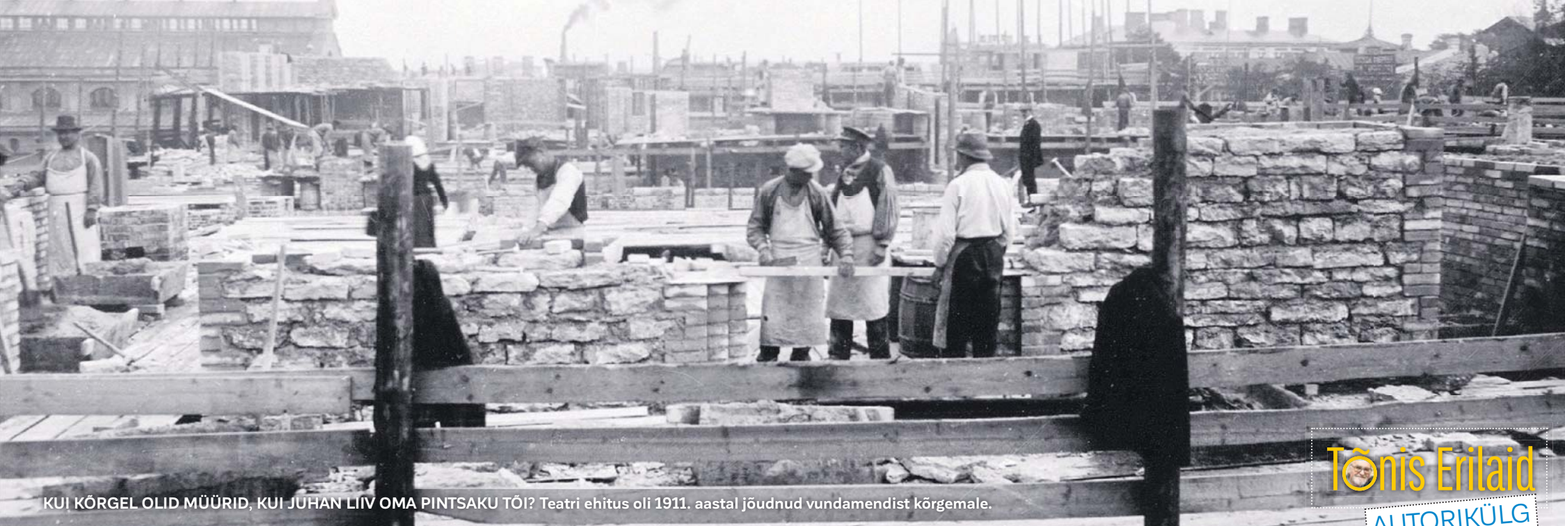
KUI KÕRTEL OLID MÜÜRID, KUI JUHAN LIIV OMA PINTSAKU TÕI? Teatri ehitus oli 1911. aastal jõudnud vundamendist kõrgemale.

Ja mis kõige tähtsam: sellel banketil tutvus Adson Marie Underiga.