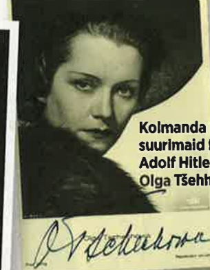
Kolmanda Reichi üks suurimaid filmistaare ja Adolf Hitleri lemmikuid – Olga Tšehhova.

→ Ungari päritolu filminäitleja ja laulja Marta Eggerth elas 101-aastaseks.