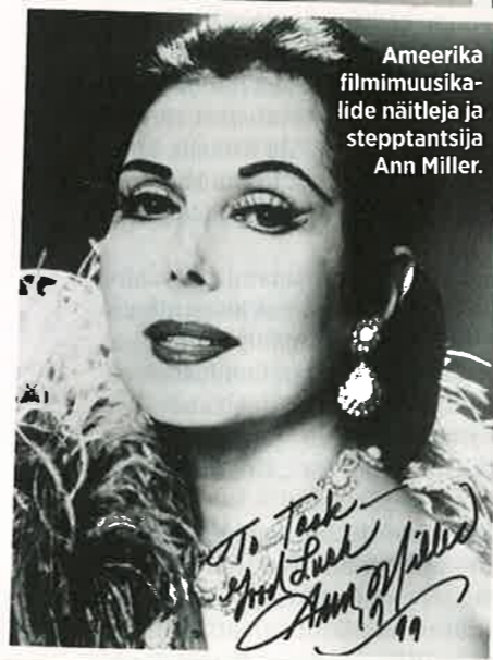
Ameerika filmimuusikaliide näitleja ja stepptantsija Ann Miller.

→ Tšehhi filminäitleja Lida Baarová oli Hitleri propaganda-ministri Joseph Goebbelsi suur armastus.