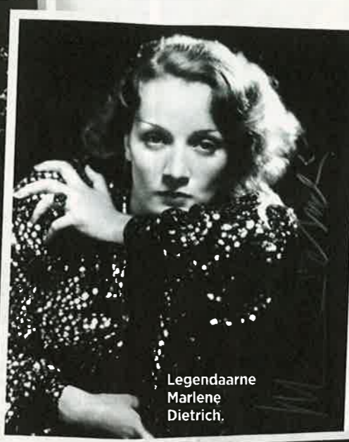
Legendaarne Marlene Dietrich.