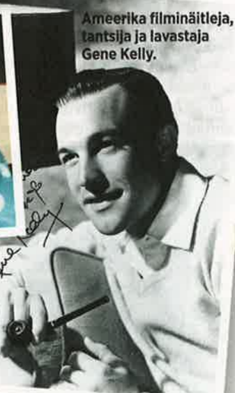
Ameerika filminäitleja, tantsija ja lavastaja Gene Kelly.

→ Poola päritolu saksa-ameerika filminäitlejanna Pola Negri äratas avalikkuse tähelepanu värvikate armuafääride ja skandaalidega.