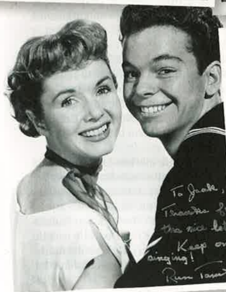
Ameerika filminäitleja ja tantsija Russ Tamblyn koos näitlejanna Debbie Reynoldsiga filmis „Hit the Deck” (1955).