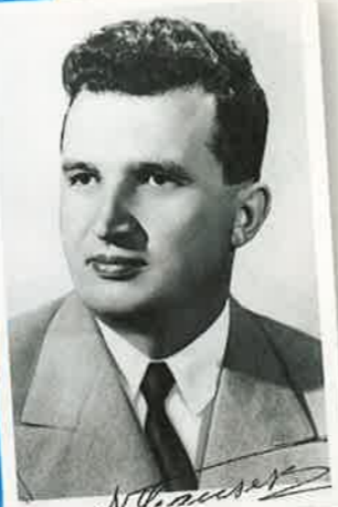
Rumeenia diktaator Nicolae Ceaușescu.

Rootsi lastekirjaniku Astrid Lindgreni foto sai Jaak läbi Rootsi saatkonna.