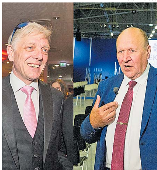
Indrek Tarand ja Mart Helme.

Mart Helme teatas 17. augustil, et esitas vandeadvokaadi vahendusel Indrek Tarandi ja Toomas Hendrik Ilvese vastu hagihoiatuse. Siseminister andis neile kümme päeva väidetavalt laimavate sõnade tagasivõtmiseks ja 50 000 euro suuruse valuraha maksmiseks. Mis on asjast nüüdseks saanud?