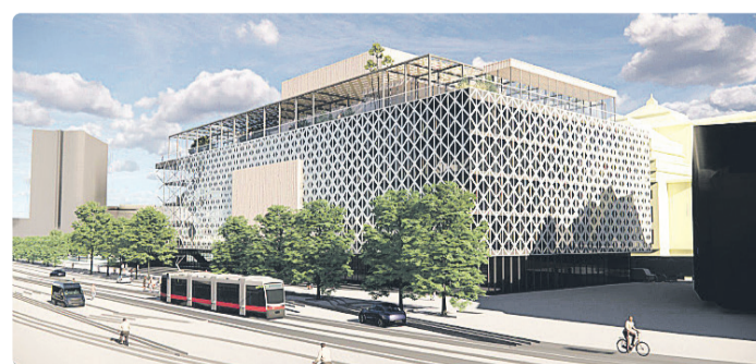
Juurdeehituse eskiis, mille kohaselt laieneks rahvusooper Estonia hoone kuni Pärnu maanteeni.

Ta lisas, et ainus võimalus teatrisaali akustika parandamiseks ning liialt väikesel lavaga seotud probleemide lahendamiseks on teatrisaali ja lava ümberehitus. Selle täpsemad võimalu-