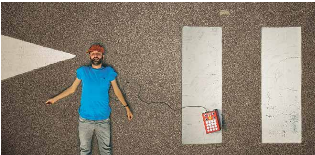
Laupäeval kell 12 esineb Musumäel Portugali soundimeister Batida