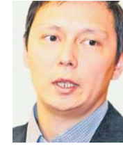
Keskerakonna Tallinna linnapea-kandidaat MIHHAIL KÕLVART