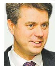
Isamaa linnapea- kandidaat URMAS REINSALU