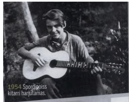
1954 Spordipoiss kitarril harjutamas.

«Muidugi muutis mu elu just see riikliku