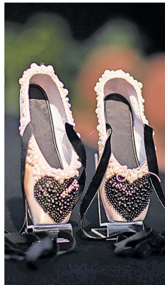
Tiina Talumehe varvaskingad.