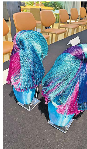
Aldo Järvasoo varvaskingad.