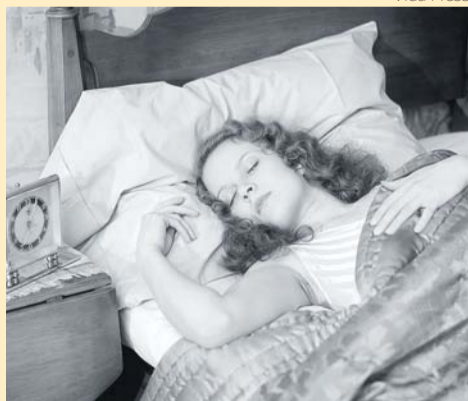
Läinud sajandi 30. aastatel tehtud fotol ei ole Eestis unehaigust põdenud tüdruk.

„Katsetati ravimitega ja saavutati häid tagajärgi.