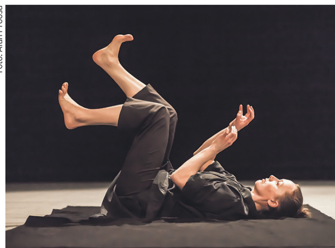
Zuga Ühendatud Tantsijate „Suur teadmatus“ pani vaataja mõtlema teistsugusele ja igaviku peale.

Tubli panuse žanri populariseerimisse on andnud improteater Impeerium. Üks põhjus on muidugi selles, et nende etendustel saab alati palju nalja. Kui kolm näitlejat kannavad ette kalapüügteemalise