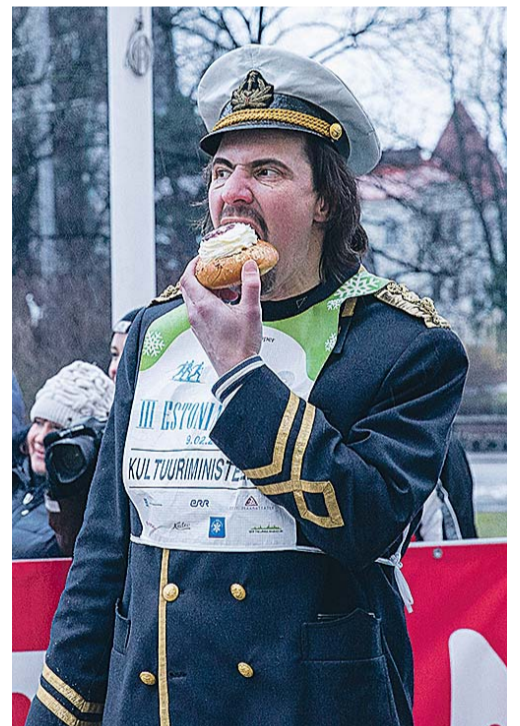
TAKISTUSRADA: Suusatamise vahepeal tuli osalejatel takistusena ära süüa kukkel. Pildil kultuuriminister Indrek Saar võistlushoos.