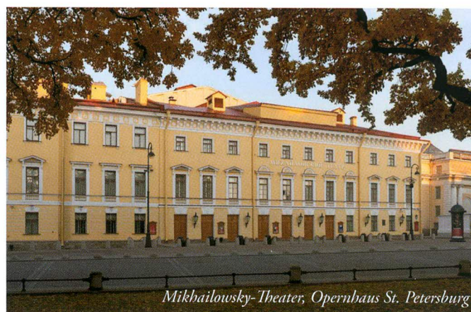
Mikhailowsky-Theater, Opernhaus St. Petersburg