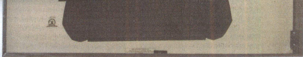
Maarit Murka. Sihimärk I. Segatehnika. Pleksiklaas, paber, õlivärv, 2011.

Loog: Aeg-ajalt olen ma tõesti näinud – ja see on nüüd negatiivne näide –, et mõni on üritanud seda teha. Mulle tundub see natuke vastutustundetult ülejäänud potentsiaalsete lugejate ees ja kindlasti ka toimetaja ees, kui su tekst läheb väga hermeetiliseks, sa võtad mingisuguseid asju antusena, eeldad, et sinu koodi osatakse lugeda, et sind mõistetakse poolelt sõnalt. Kui toimetaja mult arvustuse tellib, siis ma arvestan mõtteliselt – nii ebamäärane, kui see ka pole – selle väljande auditooriumiga, et tekst võiks olla ideaalis võimalikult kommunikatiivne võimalikult suurele hulga lugejatele. Ja selleks, et arvustus saaks olla kommunikatiivne, ei saa see olla suunatud kellelegi konkreetsele. Kunstilise teksti