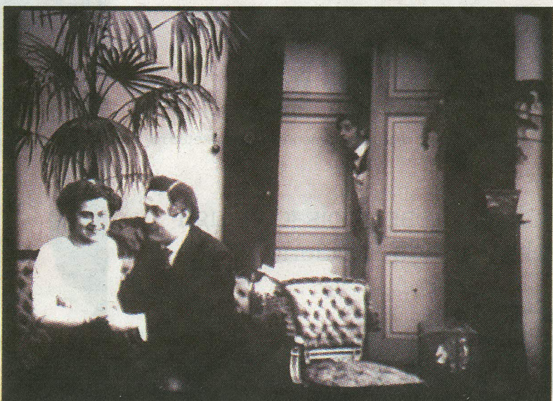
Komöödia «Laenatud naene» pakub unikaalseid Tallinna kaadreid ja tuntud eesti näitlejate mängu.