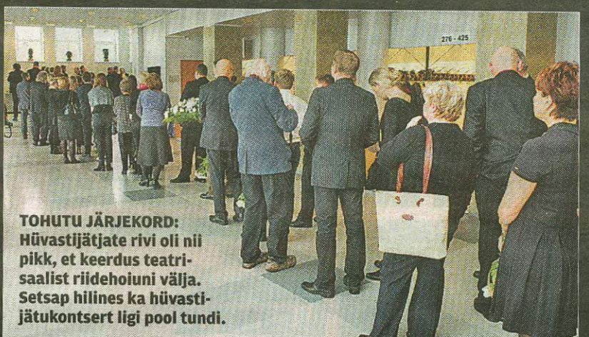
TOHUTU JÄRJEKORD: Hüvastijätjate rivi oli nii pikk, et keerdus teatri-saalist riidehoiuni välja. Setsap hilines ka hüvastijätukontsert ligi pool tundi.

Malvius. «Ta mõistis, et muusikalid on midagi palju enam kui pelk meelelahutus. Ta viskas alati nalja ning sai aru ka minu naljadest. Ma jään temast puudust tundma.»