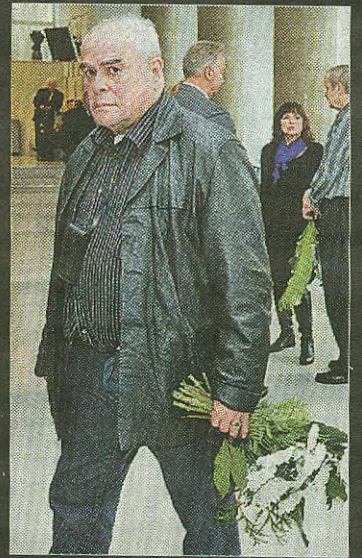
KOLLEGIID: Lahkunut saabusid mälestama nii muusika-, kui ka poliitikarahvas. Pildil on dirigent Eri Klas.