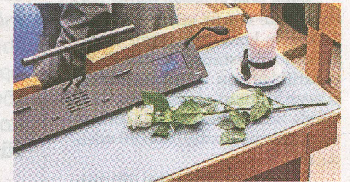
Leinatamme töökoht eile riigikogus.