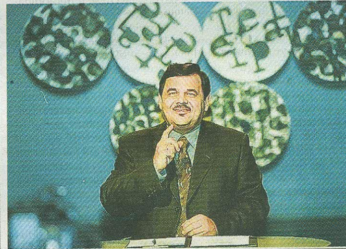
ETV neljandas stuudios. Mitu hooaega käis igal pühapäeval ETV ekraanil Leinatamme juhitud „Teletaip”. 2008. aastal kutsuti ta juhtima ülipopulaarset „Laululahingut”.