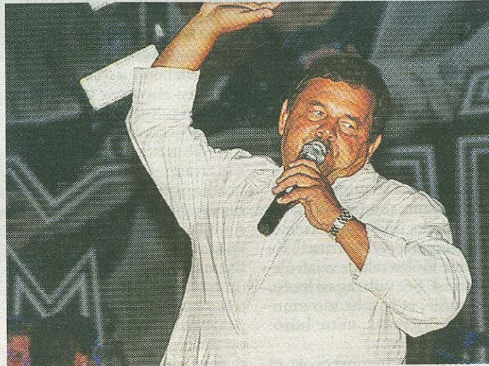
Leinatamm rokkimas 2008. aastal Meie Mehe „Sõprade tuuril”.