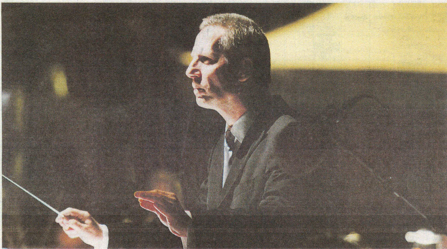
Georg Friedrich Händeli ooperi "Rinaldo" esietendus Rahvusoper Estonia tänava 18. septembril.