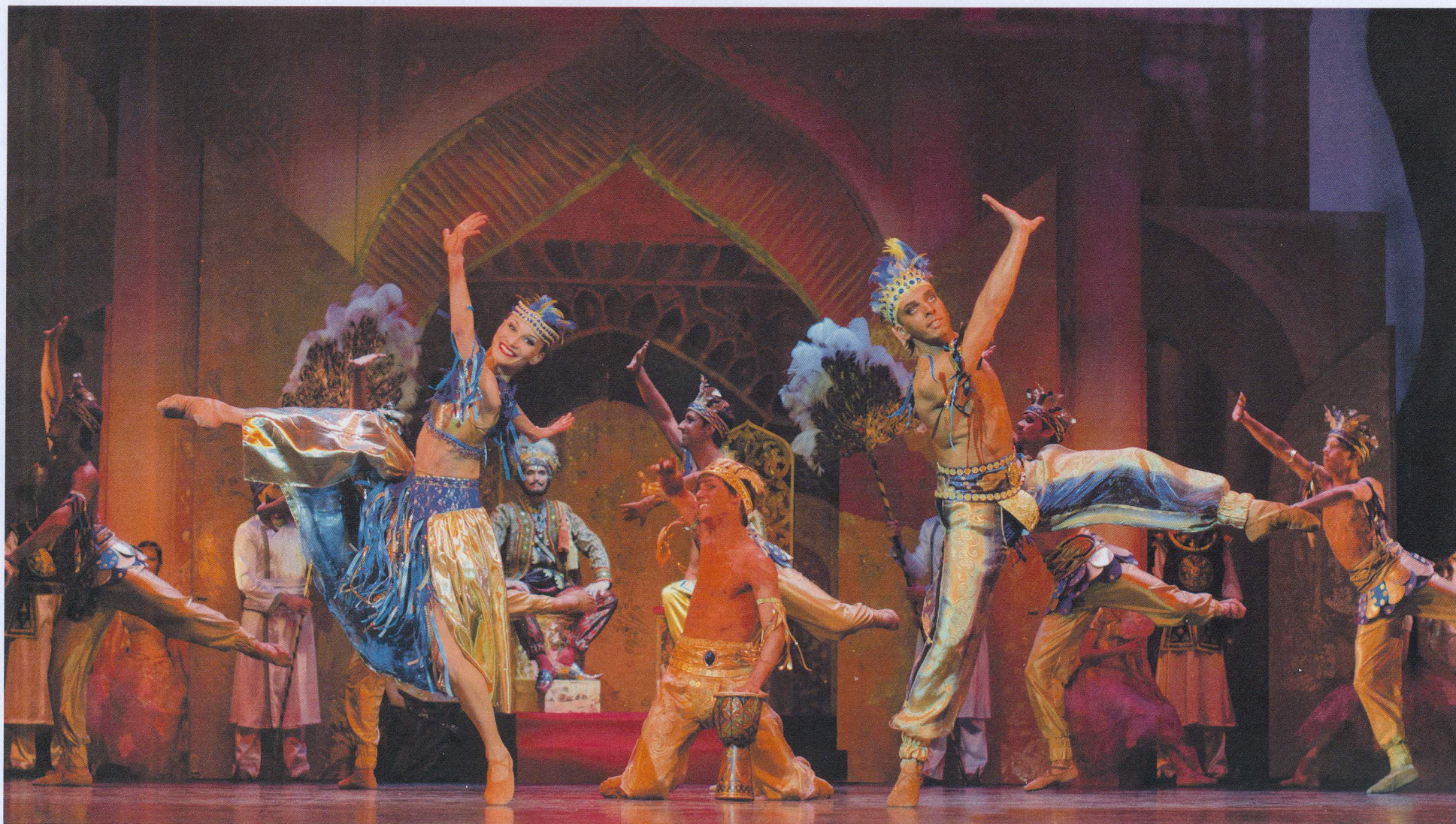
Ludvig Minkuse ballett "Bajadeer" on klassikalist ja romantilist tantsustiili ühendav etendus.