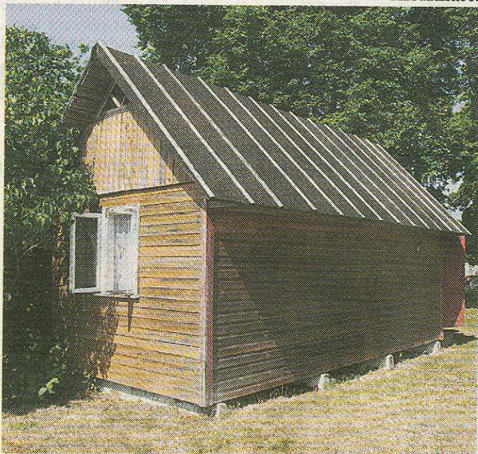
SUVEKS PIISAV: Vana piirivalvemaja, mille Klasi pere ostis kunagi 1000 rubla eest.

Õnneks on need kunagised tormilised ajad seljataga ja liialt palju külalisi Klasil enam ei käi. «Samas on siin kultuurisfäär väga tihedaks läinud. Näiteks naabriks on mul siin kunagine näitleja Tõnu Saar. Siinsamas