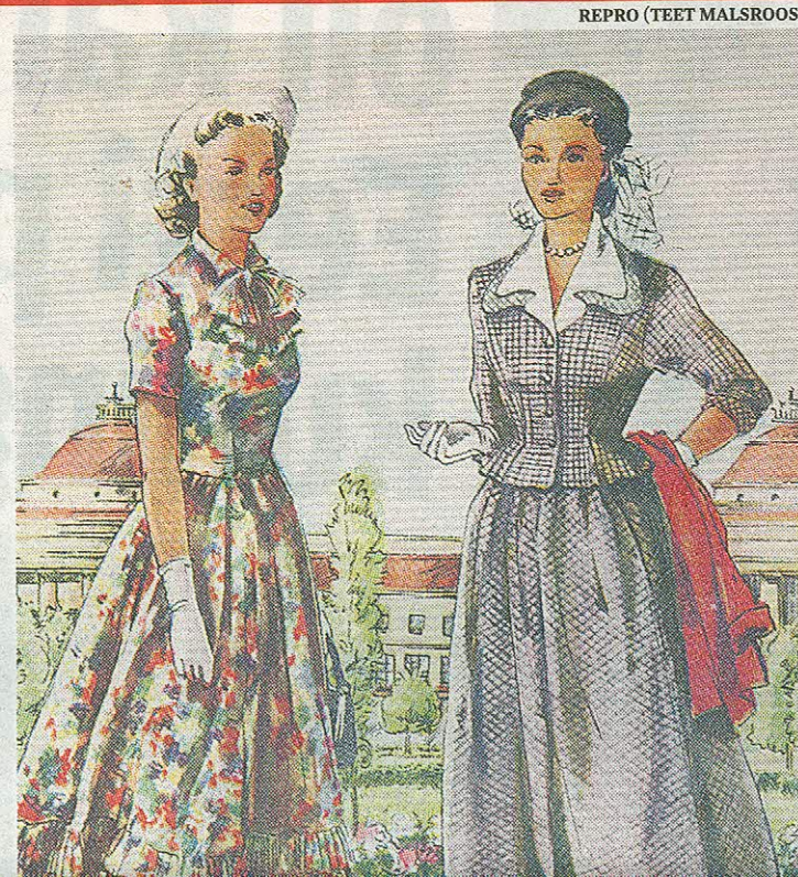
REPRO (TEET MALSROOS)