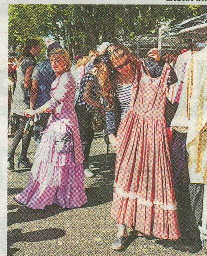
KOSTÜÜMIPIDU: Võileivahinna eest sai endale soetada Estonia kostüümilaost pärit riideid, mida abivalmid estoonlased kohapeal ka selga aitasid sättida.