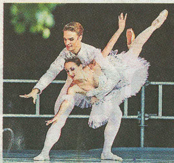
NÄIDISTANTS: Estonia teatrimaja kõrvale oli püstitatud suur välilava, kus rahvusoper Estonia artistide esituses võis näiteks näha balletipoognaid.

Mõeldes neile, kel ees ootamas mõni stiilipidu või kes sooviks lihtsalt oma riidekappi osta ekstravagantseid kostüüme, olid estoonlased tühjaks tassi-