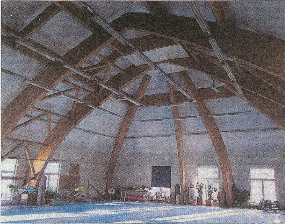
Suurten lavasteiden teko vaatii suuren verstaan.