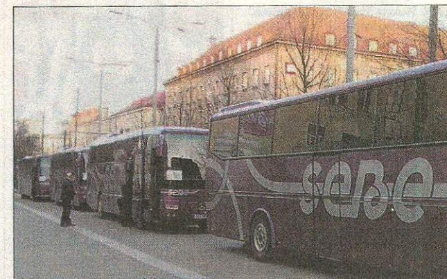
Oopperavieraita saapuu bussilasteittain kaikkialta Virossa.