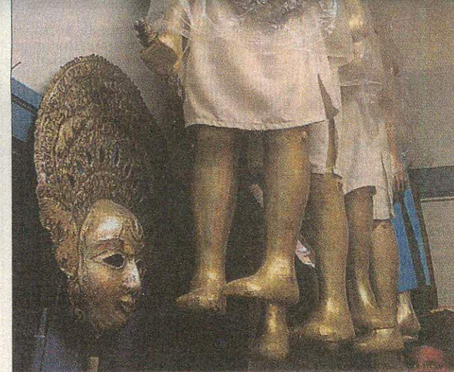
Julius Caesarin soturit odottavat seuraavaa mittelöä