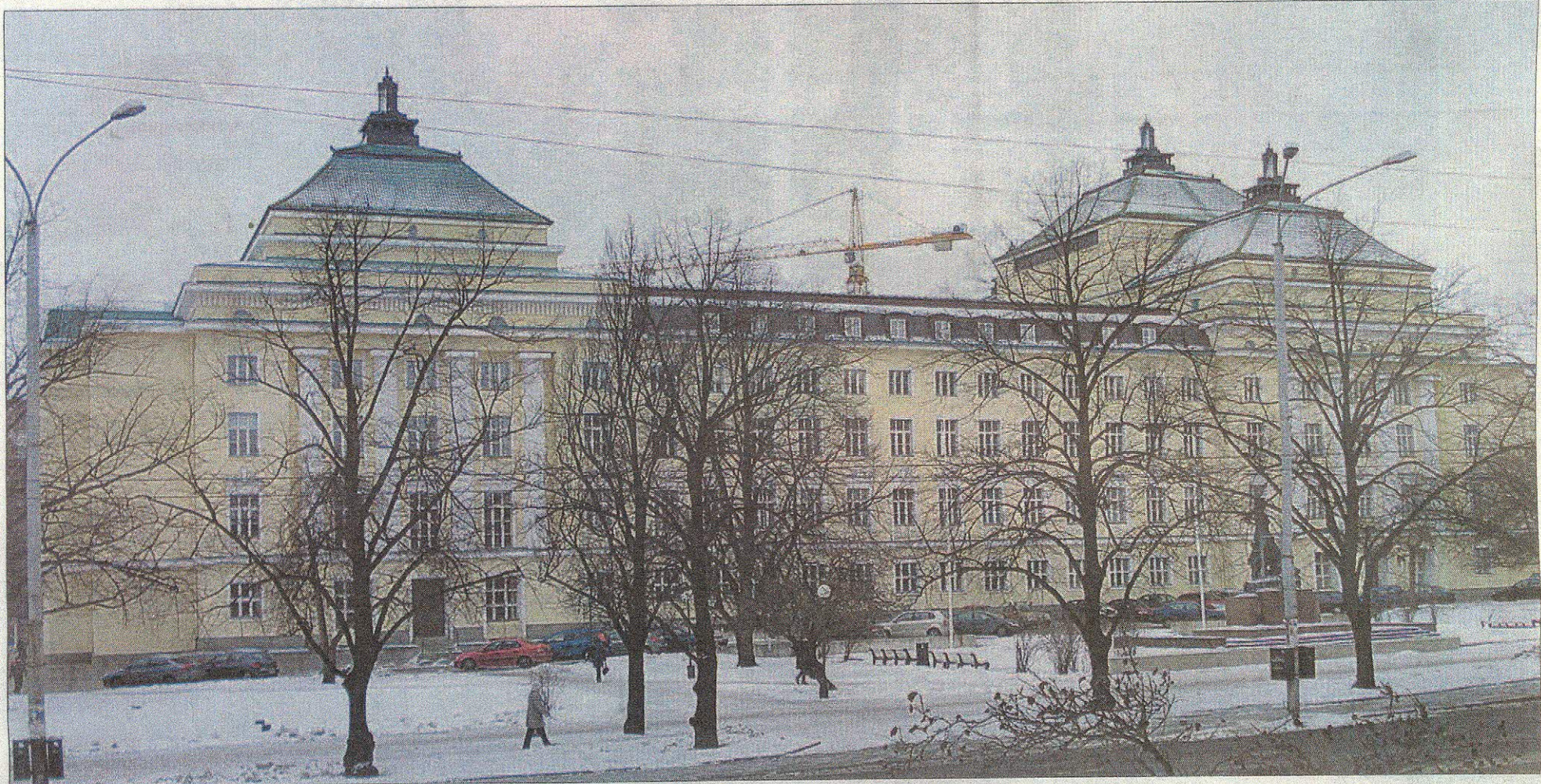
Estonia Pärnu maantien puolelta. Viidennessä kerroksessa sijaitsee pieni hotelli.

■ Estonia-rakennus on sekä Viron kansallisooppera Estonian sekä Viron valtion sinfoniaorkesterin kotipaikka