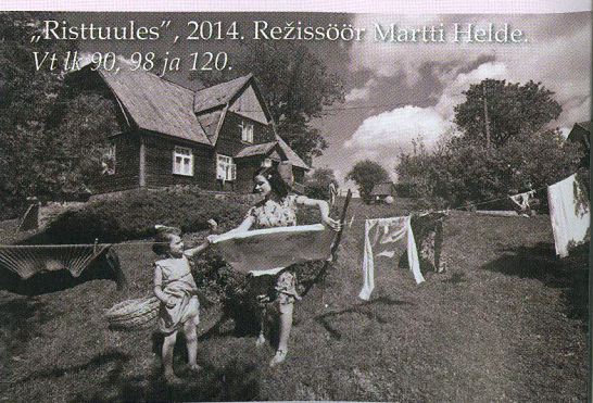
„Risttuules”, 2014. Režissöör Martti Helde. Vt lk 90, 98 ja 120.

AJAKIRI „TEATER: MUUSIKA. KINO” ILMUB EESTI VABARIIGI KULTUURIMINISTEERIUMI TOEL.