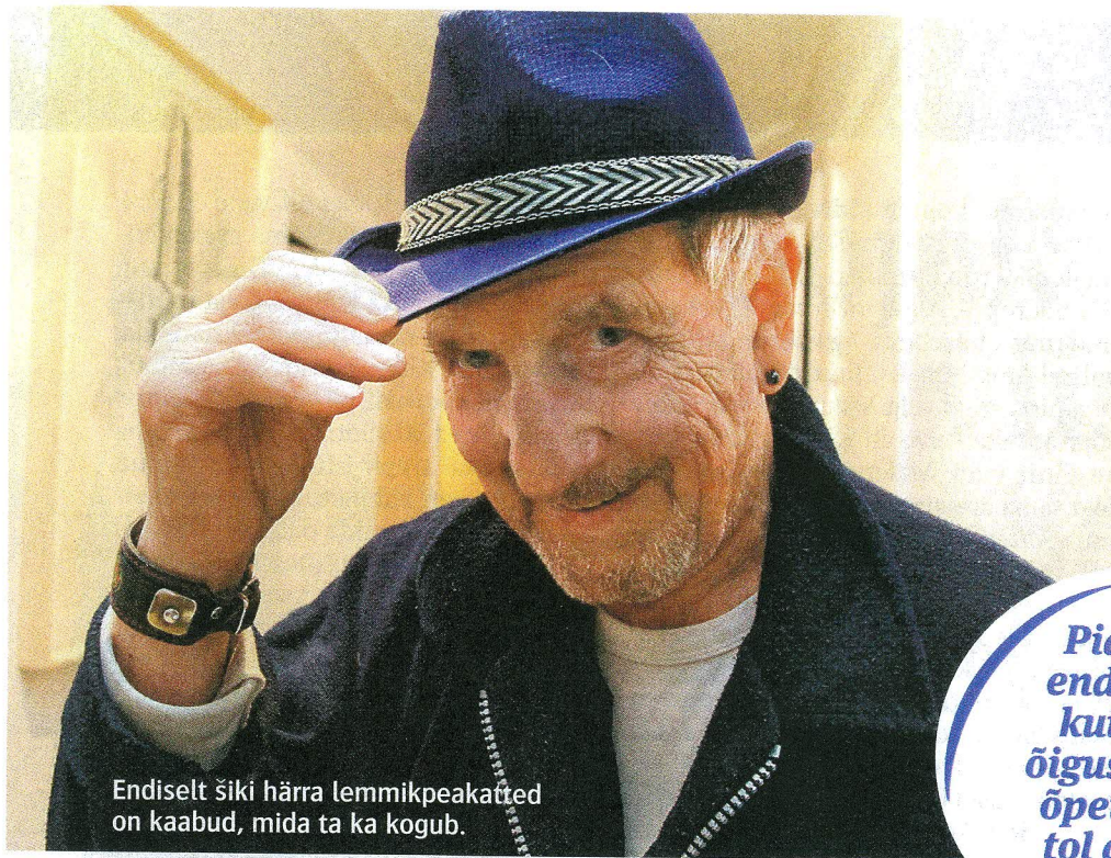
Endiselt šiki härra lemmikpeakatted on kaabud, mida ta ka kogub.