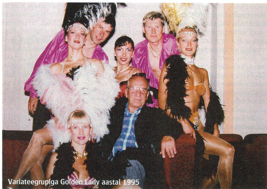
Variateegrupiga Golden Lady aastal 1995

Kodu enam ei olnud, maja oli põlenud ja ema evakueeritud.