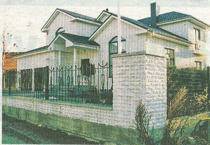
LIIGA PALJU RUUMI: Maestro Eri Klas tunnistab, et kuna lapsed elavad oma elu, on praegune kodu neile suureks kasvanud. Seepärast on see müügis.

Kuigi Birgitta festival saab tänavu kümneseks ning selle asutaja ja hing Eri Klas tähistab 75. sünnipäeva, ütleb maestro, et nendel numbritel pole tema jaoks suuremat kaalu. «Elu, mis on olnud täis muusikat ja naisi, läheb oma soodu edasi,» naerab Klas kelmikalt. «Ma olen olnud ju kolm korda abielus ning olnud alati isa, vanaisa ja vanavanaisa kõikidele minu naiste lastele, lapselastele ja lapselapselastele ning püüdnud neid aidata.»