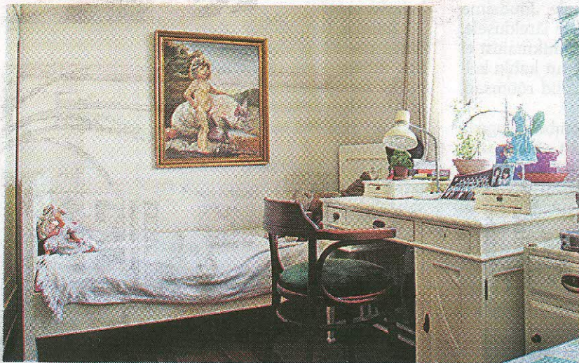
Pilgupüüdjad: maal Juuli ja pörsaga ning Judithi uhke kirjutuslaud.