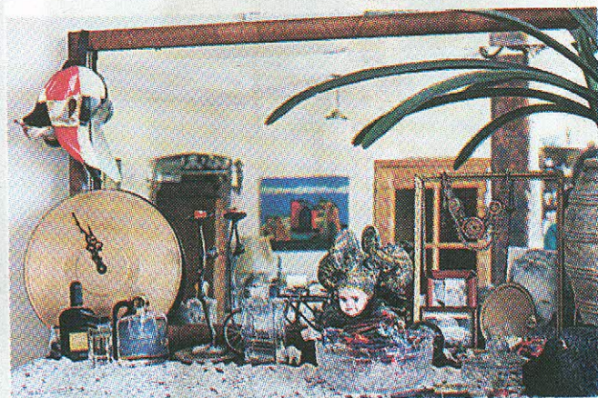
Kõnekas kooslus: iga ese võiks palju rääkida.