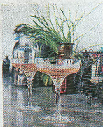
Õrnad: saja-aastased pokaalid.