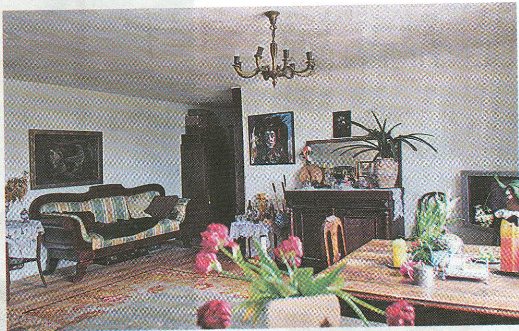
Huvi vana mööbli vastu: algas päranduseks saadud bildermeisterstilis diivanist.