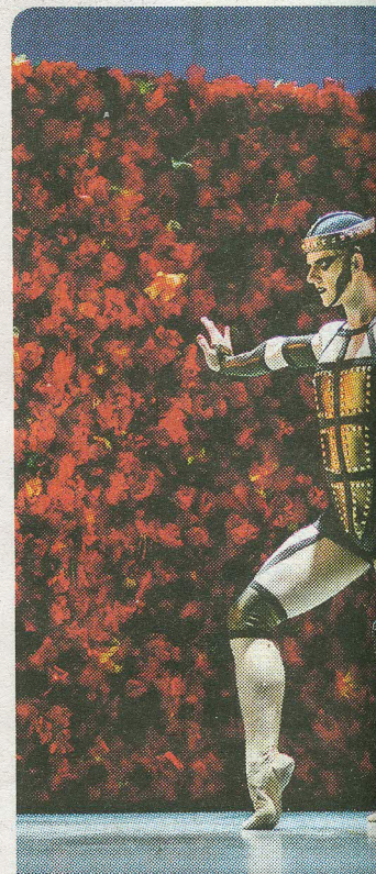
Iasonit saadab argonautide koor