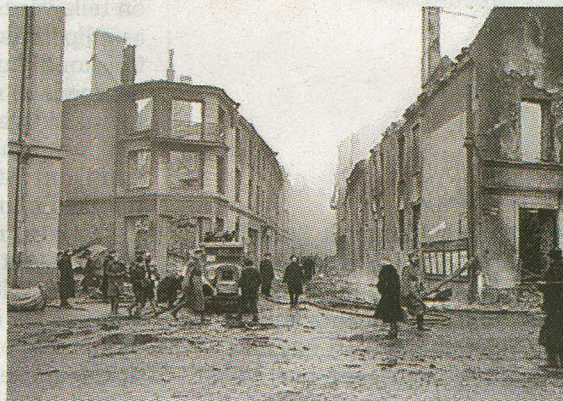
Vana-Posti ja Suur-Karja tänava nurk 10. märtsi keskpäeval.