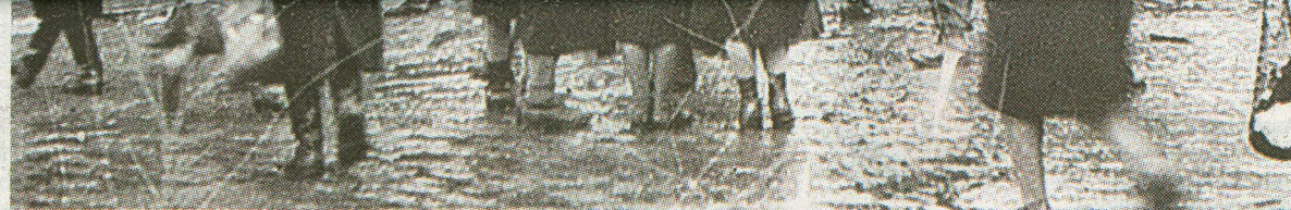
Hommik pärast hävingut: rusud, tuletõrjeautod, tallinlased ootamas kärsitult teateid oma lähedaste ning tuttavate kohta Raekoja platsi ja Harju tänava nurgal.

Vaippommitamise kuritegelikkust Tallinna ründamisel illustreerivad ohvrite arv ning purustuste ulatus. Nende kohta leiab eri allikatest erinevaid arve, kuid näiteks Tallinna Linna Tuletõrje andmetel hukkus õhurünnakus Tallinnale 777 inimest ning hävis täielikult enam kui 1500 elamut, ühiskondlikku ja majandushoonet. Tallinna politseiülema 17. märtsi salajasel lõppraportis Eesti politseidirektorile ning Tallinna julgeolekpolitsei ülemale figureerib veidi