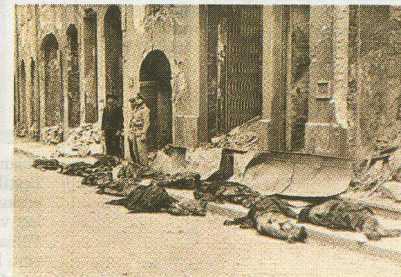
Õhurünnakute-järgsel hommikul Tallinna elanikele avanenud pilt oli äravahetamiseni sarnane sellega, mis avanes Teise maailmasõja ajal paljude Euroopa linnade elanikele.