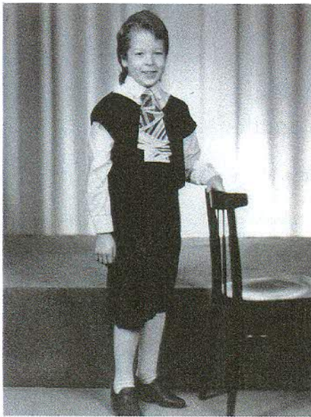
“Poistekoori A-koori kuulumine oli väga raske katsumus – kõigest 7–8-aastasi poisse pandi muudkui ette laulma.”

Ma arvan, et mul ei ole väga vaja sellest eraldi kellegagi rääkida, sest ma tekitan endas alati sisemonoloogi. Kindlasti on olnud hetki, kus rahvas alles juubeldab, aga ma ise kaon pärast esinemist ära, tundes, et peaksin partiis veel ühe või teise kohta uuesti läbi mõtlema. Küsin hiljem nõu ka inimestelt, keda usaldan. Kui soov arenda ära kaoks, ei leiaks ma oma tööl enam mõtet. Tihtipeale arvavad meie erialal töötavad inimesed, et neid peab ümmardama, kuid tegelikult on tähtis ise hakkama saada – laval oled sa ju üks. Kuna ooperilaulu eriala õppimine on praegu populaarsem kui kunagi varem, on see maailm karm. Lisaks kõigele peavad lauljad olema ka iseenda määndžerid. Kui me istume kodus, noodid põlvedel, siis keegi meid ka ei otsi. See on nagu lotogagi: kui piletit ei osta, siis võita ei saa.