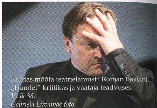
Kuidas mõõta teatrielamust? Roman Baskini „Hamlet” kriitikas ja vaataja teadvuses. Vt lk 38.