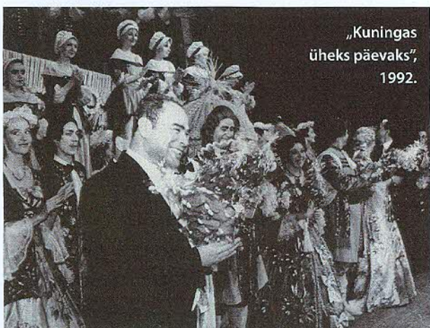
„Kuningas üheks päevaks”, 1992.