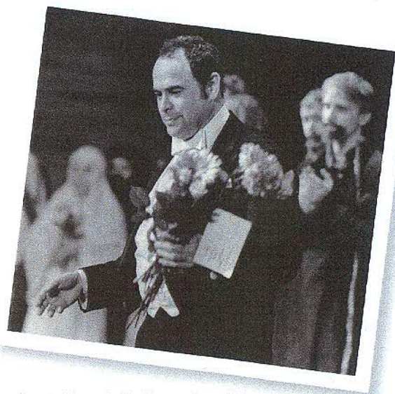
Eri Klas pärast „Hovanštšina“ etendust, 1987.

Nüüd läheb Klas aga tervist turgutama. „Mitte puhkekodusse ega spaasse, vaid arstide kontrolli alla. See on üks erakliinik, taastusravi moodi asutus. Pole küll odav lõbu, mis aga ei tähenda, et nad sind korralikult toidaksid,“ naerab Klas talle omasel võluval moel. (Klasi nooruses pani see naeratus noorte neidude südamed kiiremini põksuma.) „Samas lubasid nad teha kõik selleks, et ma