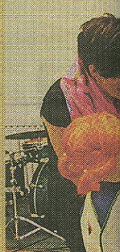
LOOSIMINE: Tänu kolm perekonda võimalus sõita E