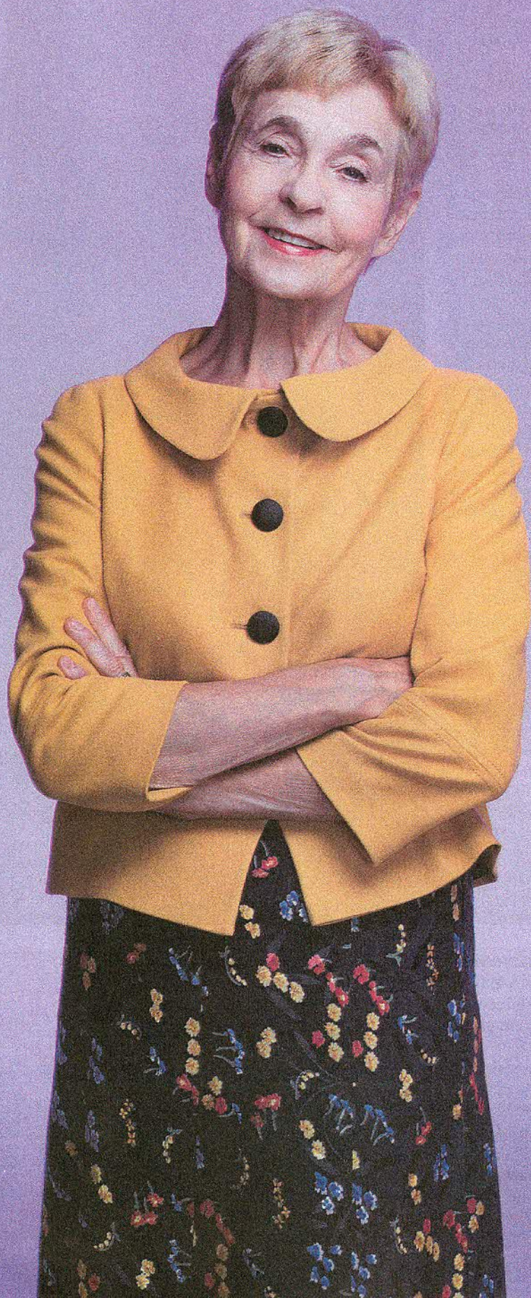
JUMESTUS: AUNE AASOJA STIIL: IMBI ILVES KOLLANE JAKK: MONTON TULPIDEGA KLEIT JA KAELAKEE: ERAKOGU

Kuigi kunagist kuulsust katab unustusteloor, on Anu Kaal ikka sama sarmikas kui vanadel headel aegadel.