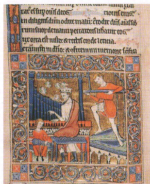
Tallinna rahvusvaheline orelfestival 2013. Miniatuur Rutlandi psaltrist nn Theophiluse oreli kujutisega u. 1260. aastast. Vt lk 63.