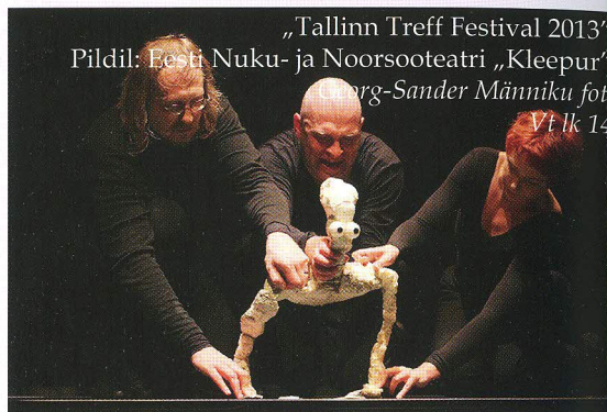
„Tallinn Treff Festival 2013“ Pildil: Eesti Nuku- ja Noorsooteatri „Kleepur“ Pärg-Sander Männiku foto Vt lk 14